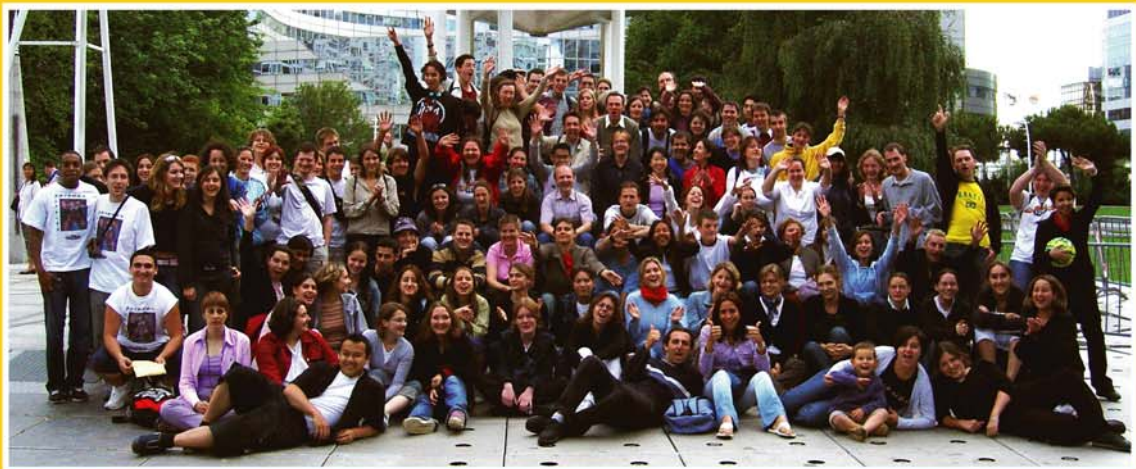
Arrivée du traditionnel Week-End Friends, juillet 2004

10 années, 236 épisodes, 6 amis, 44 célébrités, de Brad Pitt à Julia Roberts en passant par Tom Selleck et Bruce Willis, 32 personnages incontournables, de Gunther à Janice ou bien encore Jack et Judy Geller, 706 personnages secondaires en tout, 10 ans de Friends est le fruit du travail d'investigation de centaines de Fans au service de leur série culte préférée, Friends.